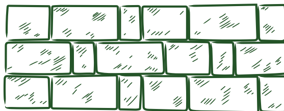
Exemple de calepinage